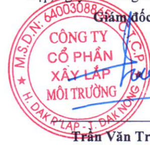
Trịnh Quốc Sơn